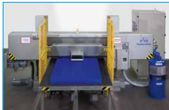
Machine à refendre H 24 G