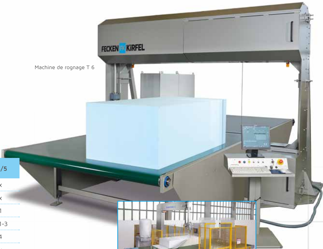
Machine de rognage T 6

Fonctionnement: La machine fonctionne avec des bandes de transport devant et derrière le couteau et un agrégat de découpe pour le modèle T 8 ainsi qu'un entraînement de couteau spécifique et peu encombrant pour la version T 6. Les guides-lames sont tournés, ce qui permet de rogner les quatre côtés et de fragmenter les plaques ainsi que les blocs.