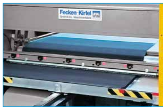
Machine à refendre H 24 F

Équipement: Les entraînements, la table et le vide de la H 24 G sont renforcés. Des rouleaux supplémentaires soutiennent le rouleau supérieur.