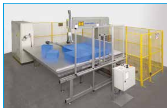
Machine de découpe à couteau-ruban verticale V 51/5

Équipement: La machine dispose d'un agrégat de découpe mobile et d'une table support fixe.