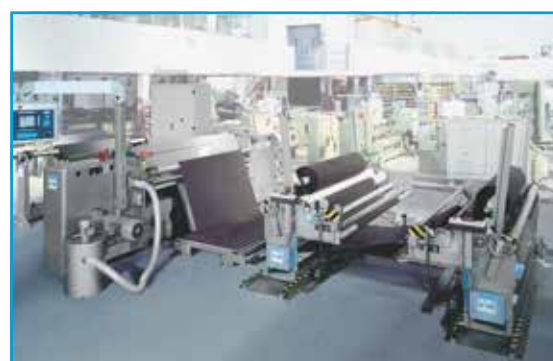
Machine à refendre G 11 avec dispositif à enrouler et dérouler

Fonctionnement: Le rouleau d'avance inférieur de la machine G 11 coulisse dans des paliers lisses pour garantir un niveau élevé de précision au niveau des rotations.