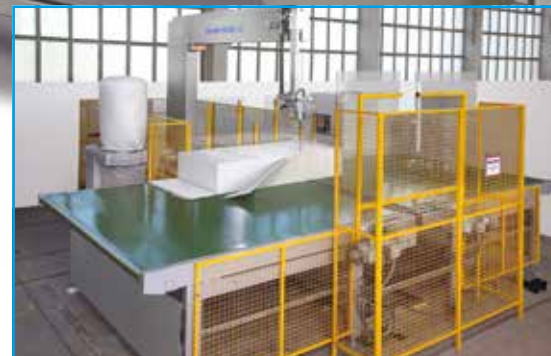
Machine de rognage T 8 S