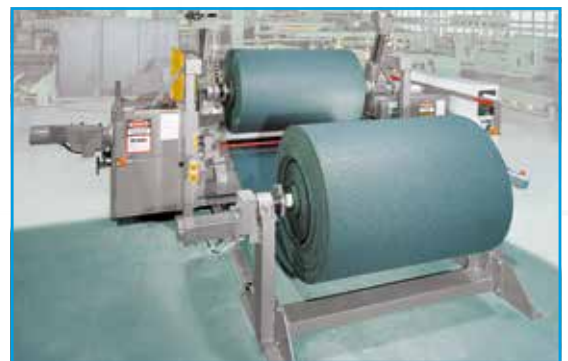
Dérouleuse R 24