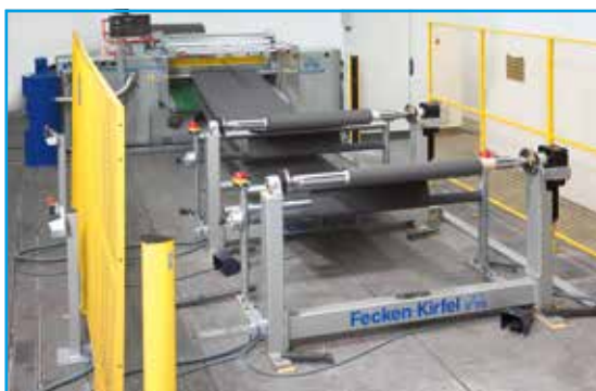
Machine à refendre K 21 et R10 et deux R 39

Équipement: Pour fabriquer les rouleaux, la machine à refendre K 21 est équipée d'un dispositif à dérouler R 10 ainsi que de deux dispositifs à dérouler R 39 et R 88.