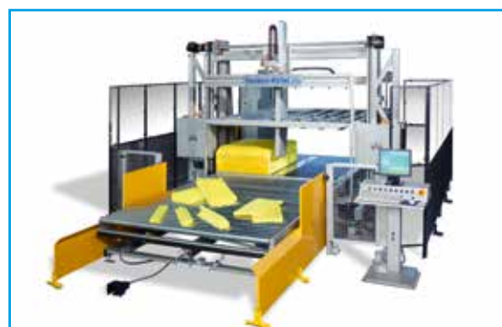
Centre CNC de découpe en forme horizontale C 69