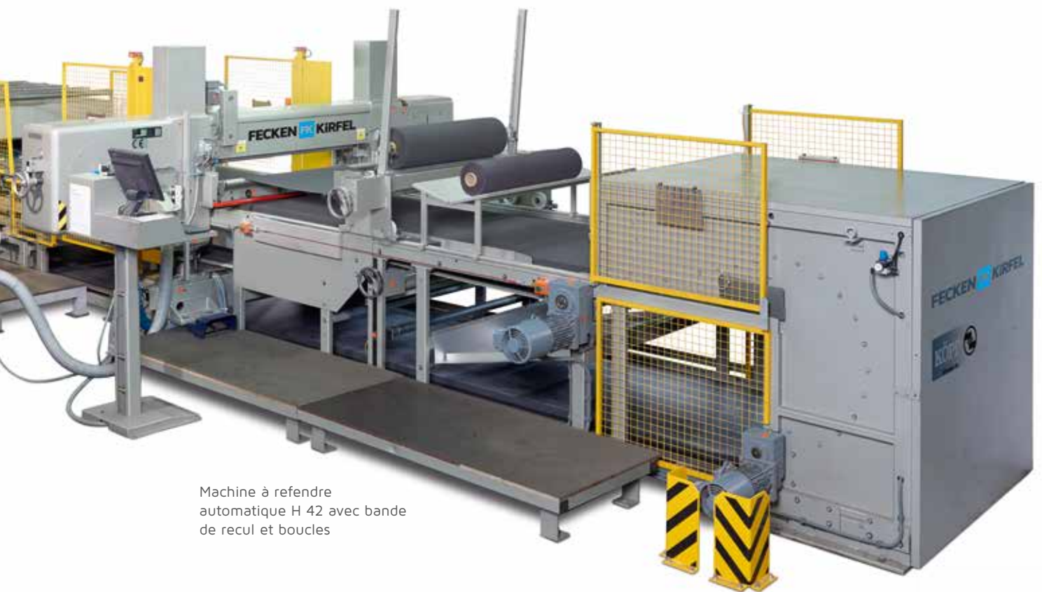
Machine à refendre automatique H 42 avec bande de recul et boucles

Machine à refendre à couteau-ruban à boucle automatique H 42 A