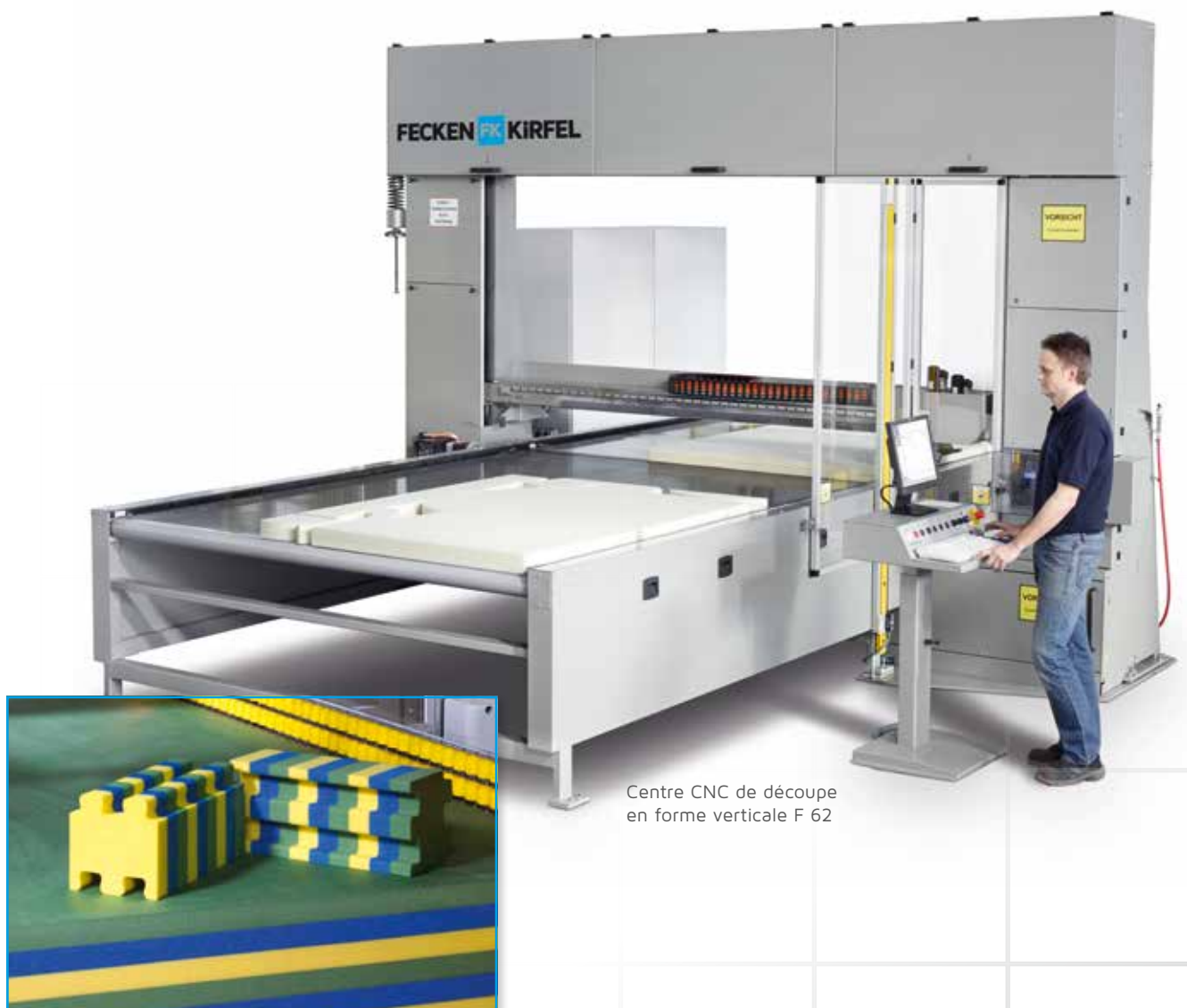
Centre CNC de découpe en forme verticale F 62

Équipement: Grâce au guide-lame breveté, vous pourrez découper, sur la F 62, les contours souhaités selon une torsion de +/- 360°, et l'espace nécessaire sera réduit au minimum.