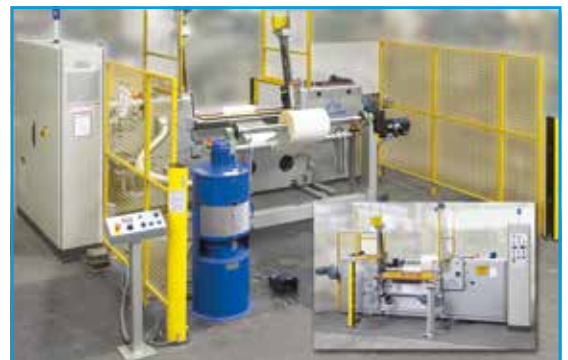
Dérouleuse R 23

Matériaux: La dérouleuse R 24 est utilisée pour fabriquer des films et des feuilles en mousse agglomérée, élastomères en polyuréthane (Vulkollan pur) et autres matériaux équivalents.