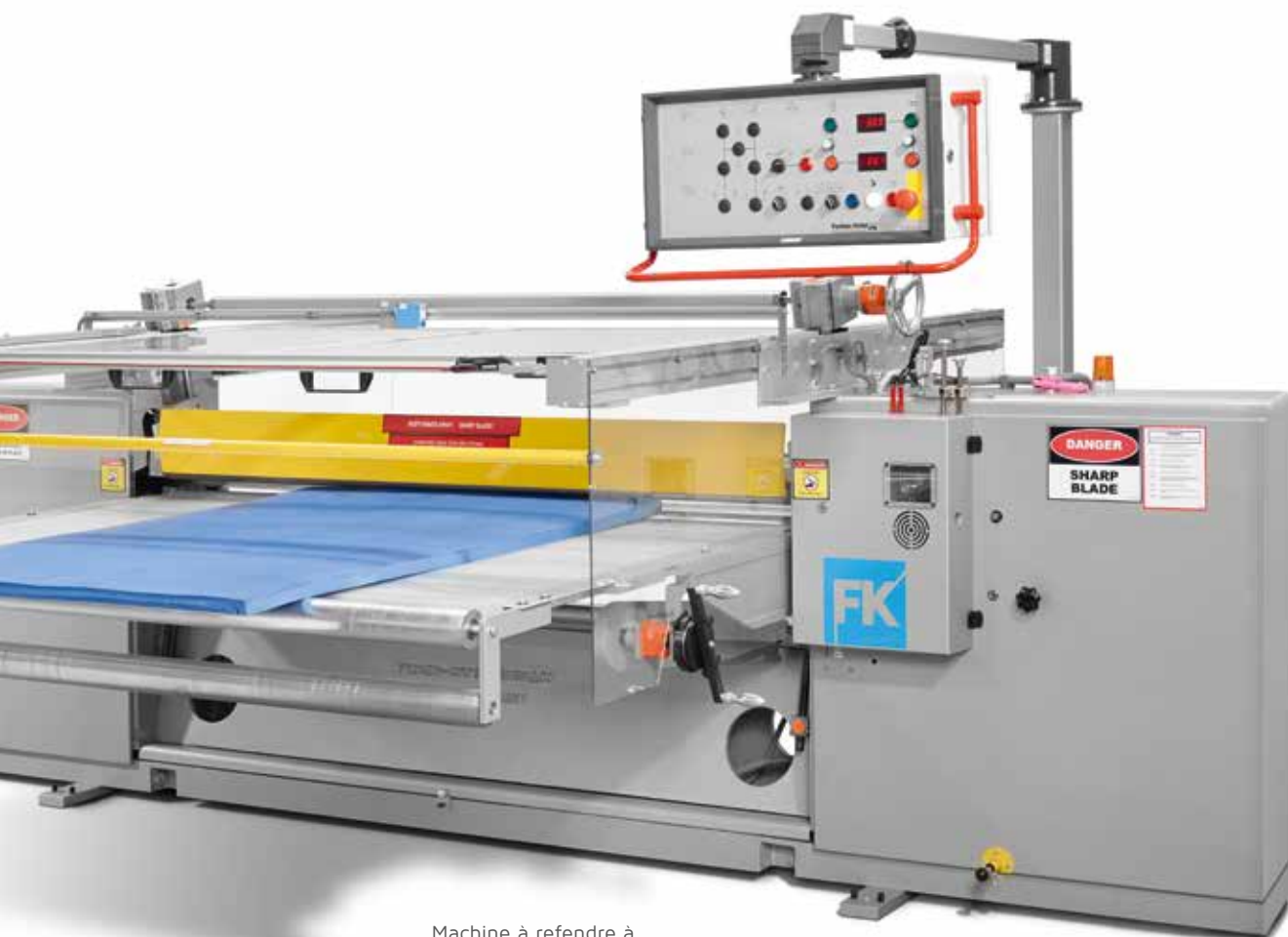
Machine à refendre à couteau-ruban manuelle K 21