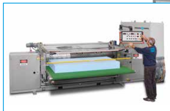
Machine à profiler D 31