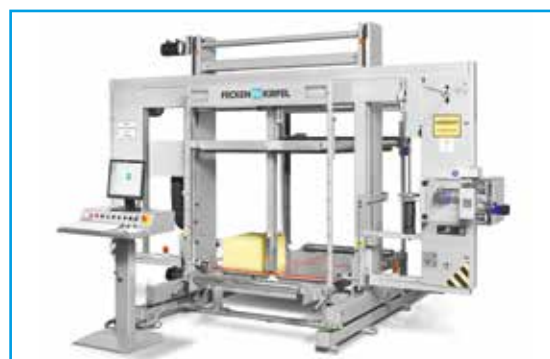
Centre CNC de découpe en forme horizontale C 56

Équipement: La technologie d'oscillation est idéale pour couper des pièces techniques et des contours à bords vifs ou de petits rayons avec des tolérances strictes. Les pièces d'usure sont réduits à un minimum, ce qui rend la machine particulièrement économique.